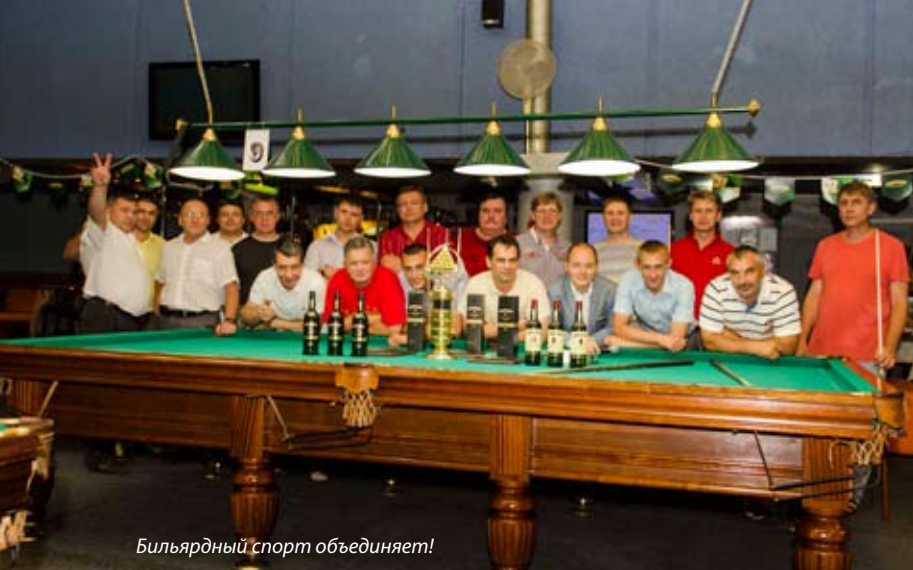
Бильярдный спорт объединяет!