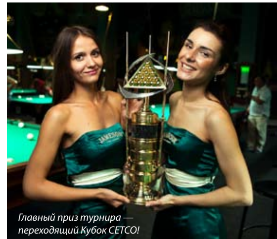
Главный приз турнира — переходящий Кубок SETCO!